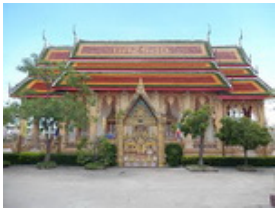
วัดบางพลีน้อย ตั้งอยู่ที่ หมู่ 1 ตำบลบางพลีน้อย อำเภอบางปะ

จังหวัดสมุทรปราการ ริมนถนนบางนา-ตราด ฝั่งขาเข้ากรุงเทพฯ ประมาณกิโลเมตรที่ 33